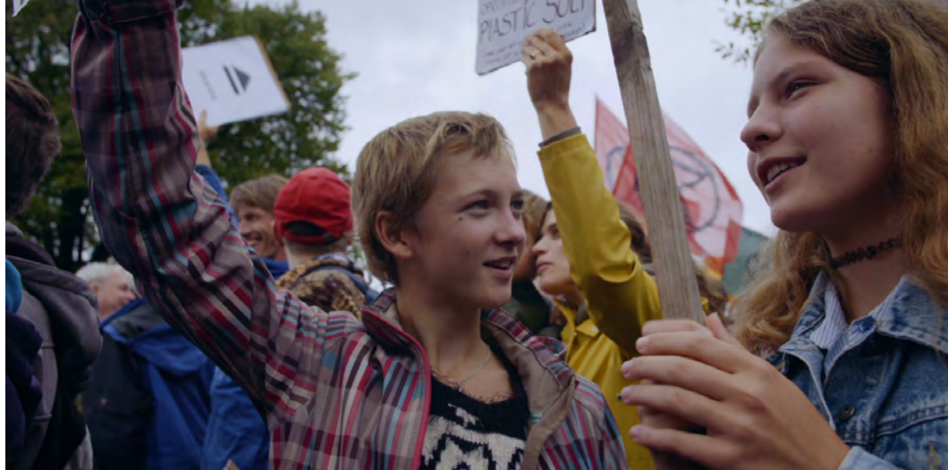
Świat wokół nas