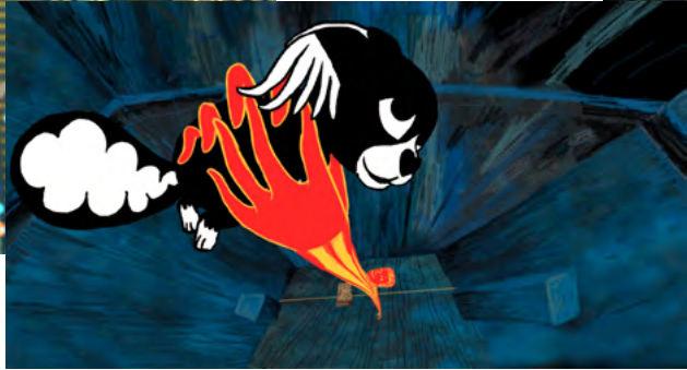
Marona – psia opowieść