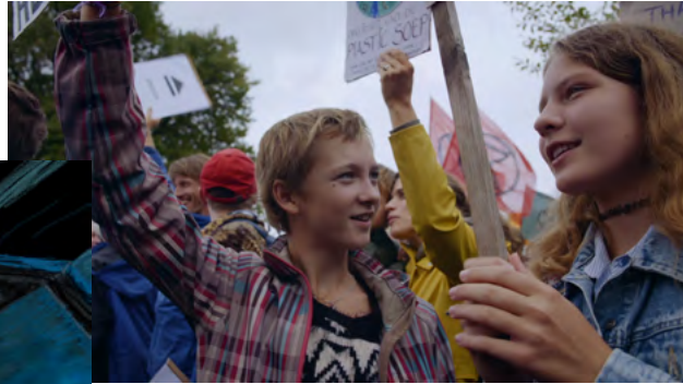
Świat wokół nas