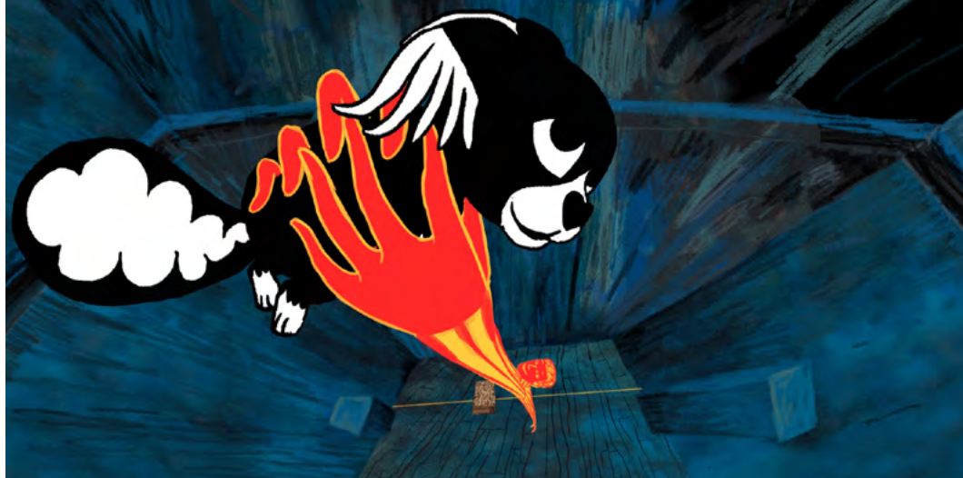
Marona – psia opowieść