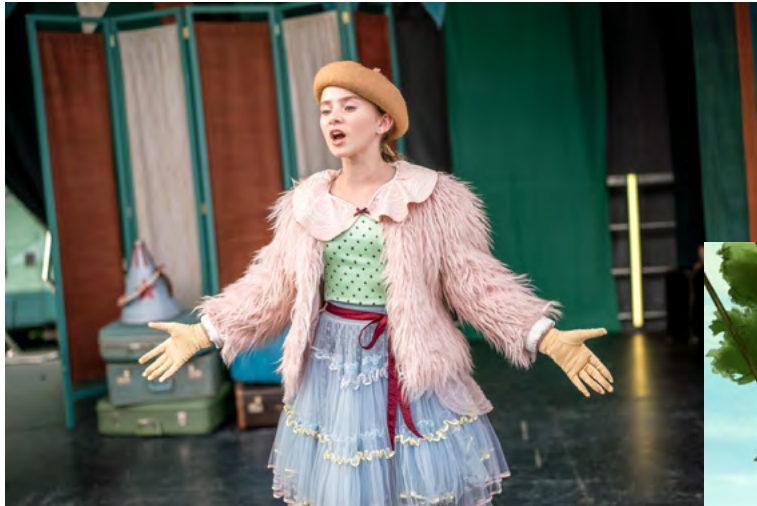
Moje życie to cyrk